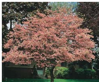
Cornouiller au printemps

Les floraisons sont souvent spectaculaires. En hiver, les branches dépouillées de feuilles gardent un aspect esthétique et laissent passer plus de lumière.