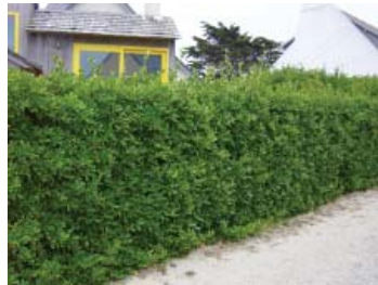
Fusain du Japon Adapté au bord de mer, à l'ombre, au soleil, aux sols ingrats.

Certaines espèces se limitent naturellement à une hauteur de 2 à 3 m.