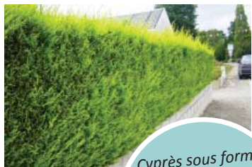
Cyprès sous forme de haie taillée... et à l'état naturel Hauteur : 20m Branches et tronc épais