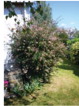
Abelia Grandiflora Pousse rapide, petites feuilles caduques, fleurs blanches à blanc rosé.