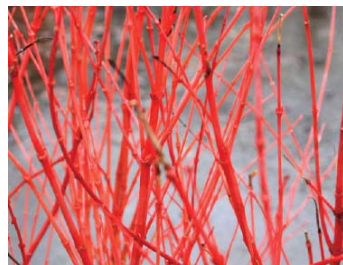
Cornouiller en hiver