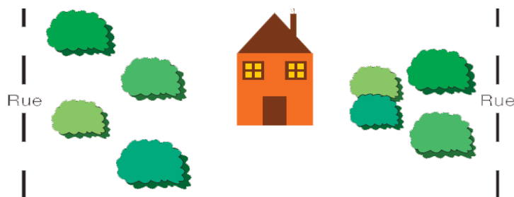
Disposition d'arbustes en quinconce.

Des massifs d'arbres et d'arbustes judicieusement disposés créent une bonne intimité au jardin et à la maison vis-à-vis de la rue, tout en réduisant les contraintes liées à l'entretien, et le volume de déchets verts.